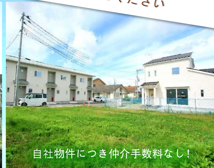
自社物件につき仲介手数料なし!